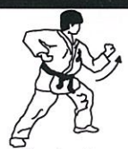
Opstoot Age tsuki