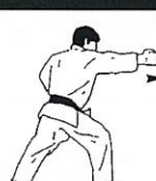
Stoot met vingers Nukite tsuki