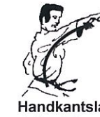
Handkantslag duimzijde Haito uchi