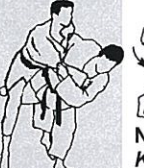
Heupworp met been Uchi mata