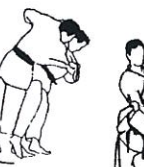
Heupworp O goshi