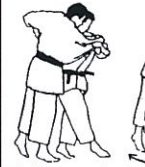
Zwiepende heupworp Harai goshi