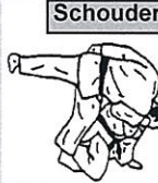
Schouderworp geknield Sei nage