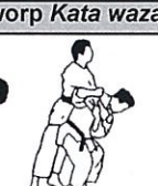
Schouderworp Sei nage