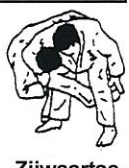
Zijwaartse wielworp Yoko guruma