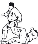
Knieschaar Hiza basami