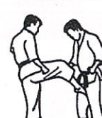
Opwaartse trap Kin geri