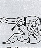
Buikworp Tomoe nage