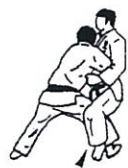
Buitenwaartse beenhaak Ko soto gake