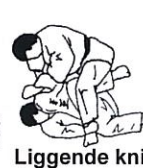
Liggende knie-druk Kani ashi garami