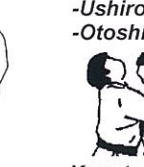
Kopstoot voor en achter Atama ate Atama ushiro ate