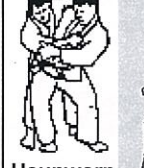
Heupworp Uki Goshi