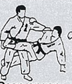
Gesprongen schaar Tobi kami basami