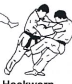
Hoekworp Sumi gaeshi