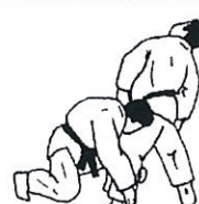
Knie enkelruk Kata ashi dori