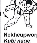
Nekheupworp Kubi nage