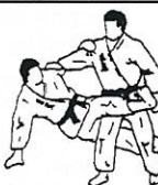
Dubbele been schaar Kami basami