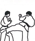
Low kick Keikotsu geri