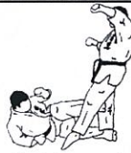
Knietrapp enkelruk Kani ashi basami