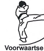
Voorwaartse cirkel trap Mawashi geri