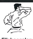
Elleboogslag naar hoofd Age empi