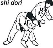
Twee benen armworp van achteren Ushiro ryo ashi dori