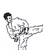
Achterwaartse trap Ushiro geri