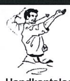
Handkantslag pinkzijde Shuto uchi