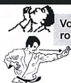
Handpalmstoot Teisho tsuki