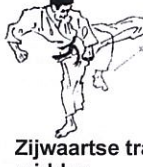
Zijwaartse trap midden Yoko geri