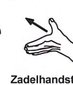
Zadelhandstoot Toho tsuki