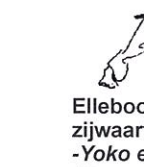
Elleboog slag zijwaarts - Yoko empi uchi - Mawashi empi - Ushiro empi - Otoshi empi