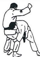
Twee benen armworp Ryo ashi dori