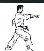
Rechte stoot instappen Jun tsuki