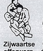
Zijwaartse offerworp Ko uchi maki komi