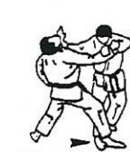
Kleine binnenwaartse maai Ko uchi gari