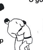
Rugwaartse heupworp Ushiro goshi