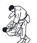
Grondschaar Kani basami