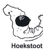
Hoekstoot Kagi tsuki