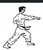
Rechte stoot contraststap Gyaku tsuki