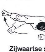
Zijwaartse slag Uraken uchi