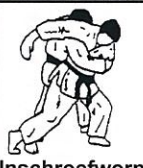
Inschroefworp Soto makikomi