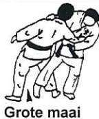
Grote maai van buiten O soto gari