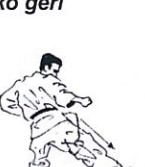
Zijwaartse trap Fumikomi geri