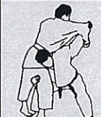
Schouderworp Kata guruma