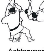
Achterwaartse offerworp Tani otoshi