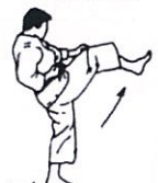
Voorwaartse trap Mae geri